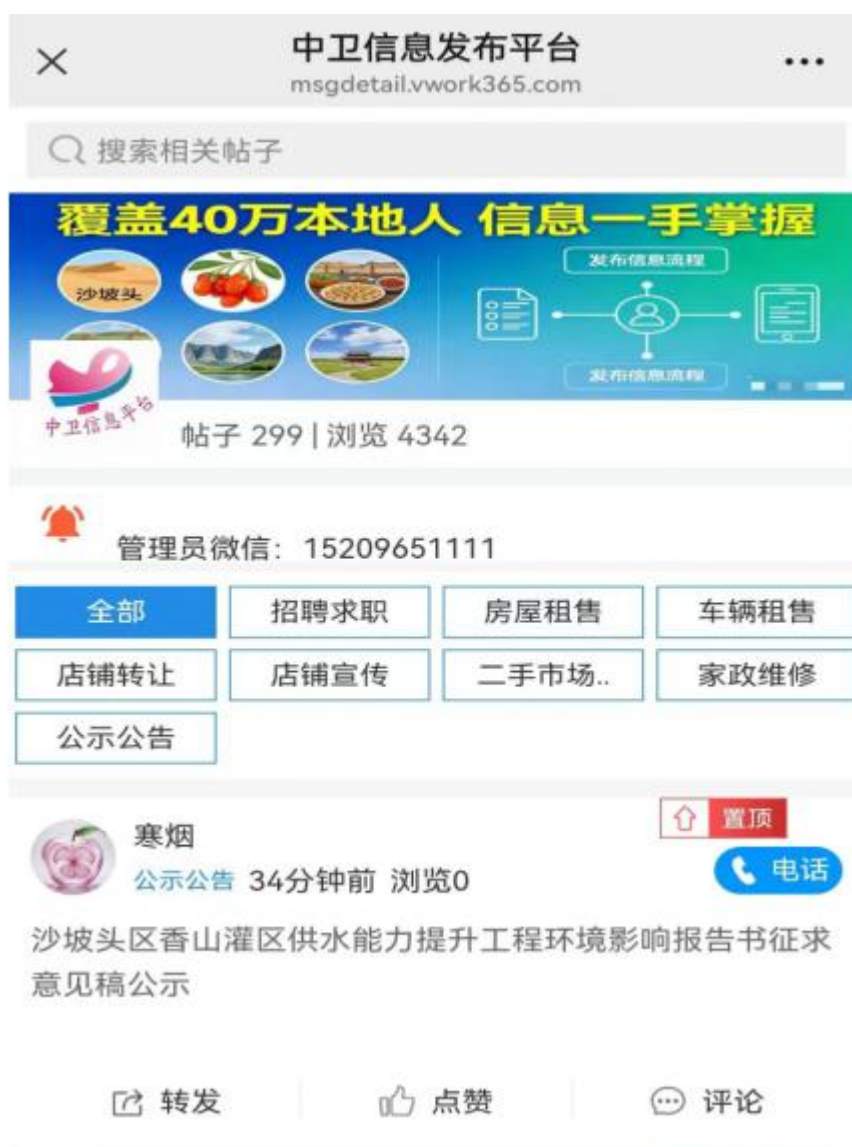
图3 报告书征求意见稿网络公示信息截图