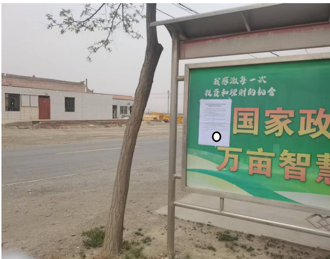
图4 公示张贴现场照片