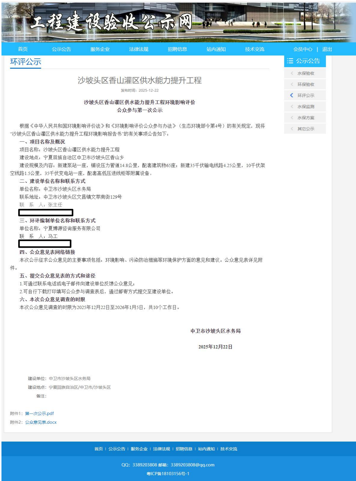
图1 第一次网络公示信息截图