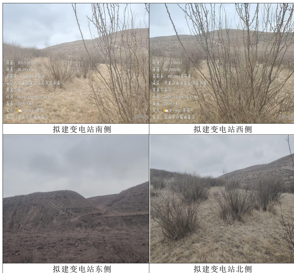
图 3-1 本项目所在区域生态现状

根据《宁夏植被分布图》，本项目所在区域植被类型区为 IAL1b 宁南黄土高原南部森林草原化森林草原及栽培植被小区，该区域以春小麦为主、含玉米、糜谷、洋芋、油料一年一熟作物，根据现场踏勘，本项目所在区域主要植被类型为灌木林地，该区域植被覆盖率 40%~50%，本项目与宁夏植被区划位置关系见图 3-4、本项目植被覆盖见图 3-5。